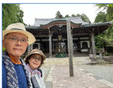
根本中堂 (大正時代の再建)