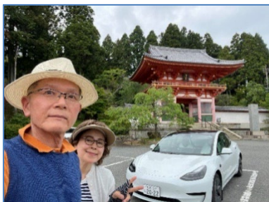
まばゆい仁王門 (朱塗り)