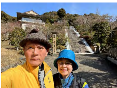
本堂に上がる石段 (60 段)