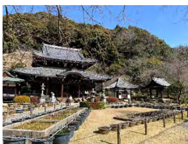
芝生の広がる境内 (本堂)