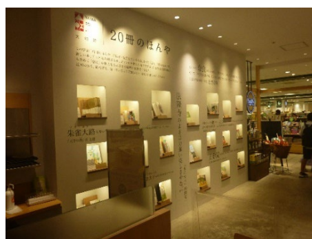
コーヒーショップ内「20冊のほんや」